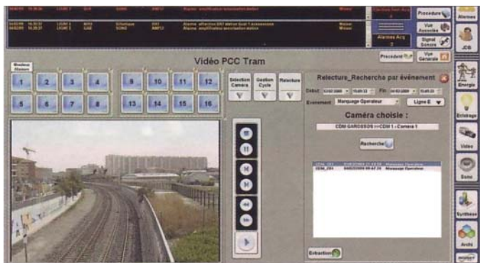
▲ Рис. 2. Пример применения функции “видеомагнитофон” в PcVue в системе диспетчеризации и управления новым трамваем в Тулузе

В PcVue 9.0 значительно расширена поддержка специализированных протоколов по