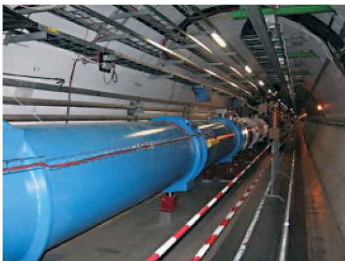
▲ Рис. 3. Фрагмент Большого Адронного Коллайдера, мониторинг систем вентиляции которого осуществляется с помощью PCVue

PCVue широко применяется в различных отраслях, таких как: управление технологическими процессами, зданиями, водоснабжением; управление инфраструктурами; энергетика; транспорт. На сегодняшний день продано более 38000 лицензий PCVue по всему миру. Приведенные в данной статье краткие описания новых возможностей в PCVue 9.0 еще раз подтверждают заслуженную репутацию PCVue по таким ключевым характеристикам, как функциональность, производительность, безопасность и надежность и будут способствовать более широкому распространению этого SCADA-пакета в России, где PCVue завоевывает все большую популярность. В качестве