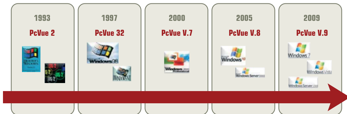
Рис. 1. Этапы развития PCVue

PCVue предназначен для создания систем сбора данных, диспетчерского управления и мониторинга различного масштаба, начиная от автономных операторских мест и кончая распределенными системами управления, в которых задействованы сразу несколько рабочих станций, объединенных в сеть с возможностями поддержки средств обеспечения избыточности, дублирования и безопасности (в том числе шифрования данных). Как и в любом серьезном современном SCADA-пакете, в PCVue имеются такие компоненты, как внутренняя или внешняя база данных реального времени и истории, мощный 2D- и 3D- графический редактор с поддержкой эффектов анимации, генератор отчетов, встроенный язык программирования, web-интерфейс (“тонкий клиент”), средства разграничения прав доступа и сопровожде-